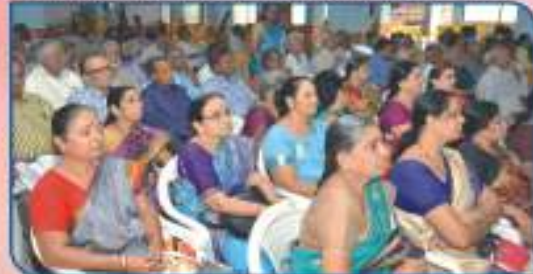
Section of the Audience

सूचना : १) या मासिकांत प्रसिद्ध झालेल्या लेखांतील मराठी संपादकमंडळ सहमत असेलच असे नाही. तसेच जाहिरातीतील मजकुराची सत्यासत्यता यमासदांनी स्वतः पडताळून घ्यावी. त्याबाबत असोसिएशन वा 'संवाद' चे संपादक मंडळ जबाबदार असणार नाही. २) असोसिएशनचे कार्यालय, सोमवार ते शुक्रवार, संध्याकाळी ६ ते ७.३० वा वेळालाच उघडे असते. याची कृपया नोंद घ्यावी. संपर्क टाऊन्सची क्रमांक : (०२०) २४३३२२४९